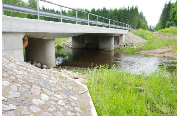
Sild I kategooria teel