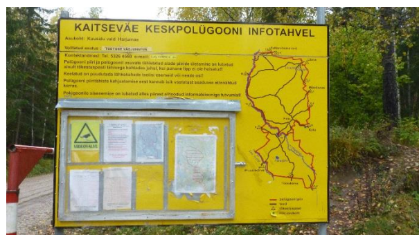
KVKP infotahvel peasissepääsul (Karjäari teel)