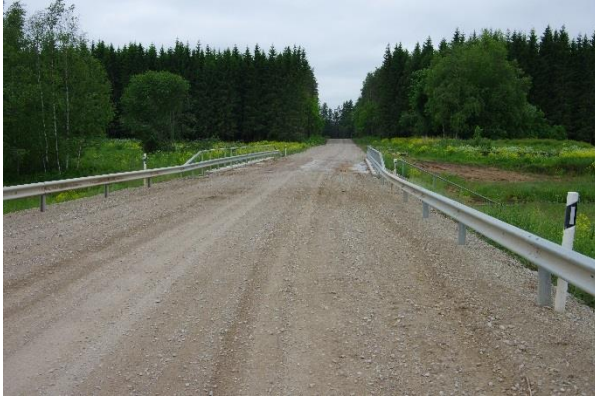
I kategooria tee ja sild