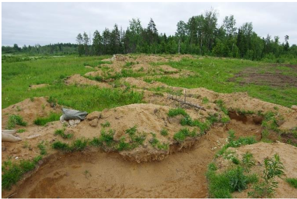
Laske- ja õppeväli peale õppust