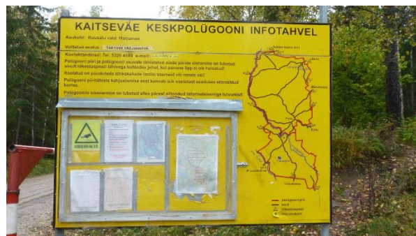
KVKP infotahvel peasissepääsul (Karjäari teel)