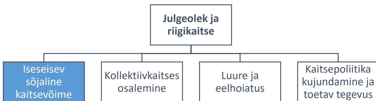
Skeem 1. Programmi asetus riigi strateegilise juhtimise vaates*

* Programm „iseseisev sõjaline kaitsevõime“ on üks neljast tulemusvaldkonna „julgeolek ja riigikaitse“ programmist. Kõigi tulemusvaldkonda kuuluvate programmide vastutaja on Kaitseministeerium.